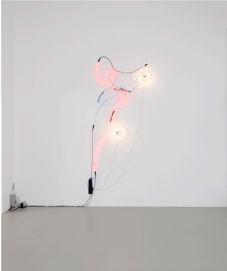
Vue de l'exposition, Files, Shields and Neons , Galerie Mitterrand, Paris, 2020 / Exhibition view, Files, Shields and Neons , Galerie Mitterrand, Paris, 2020.