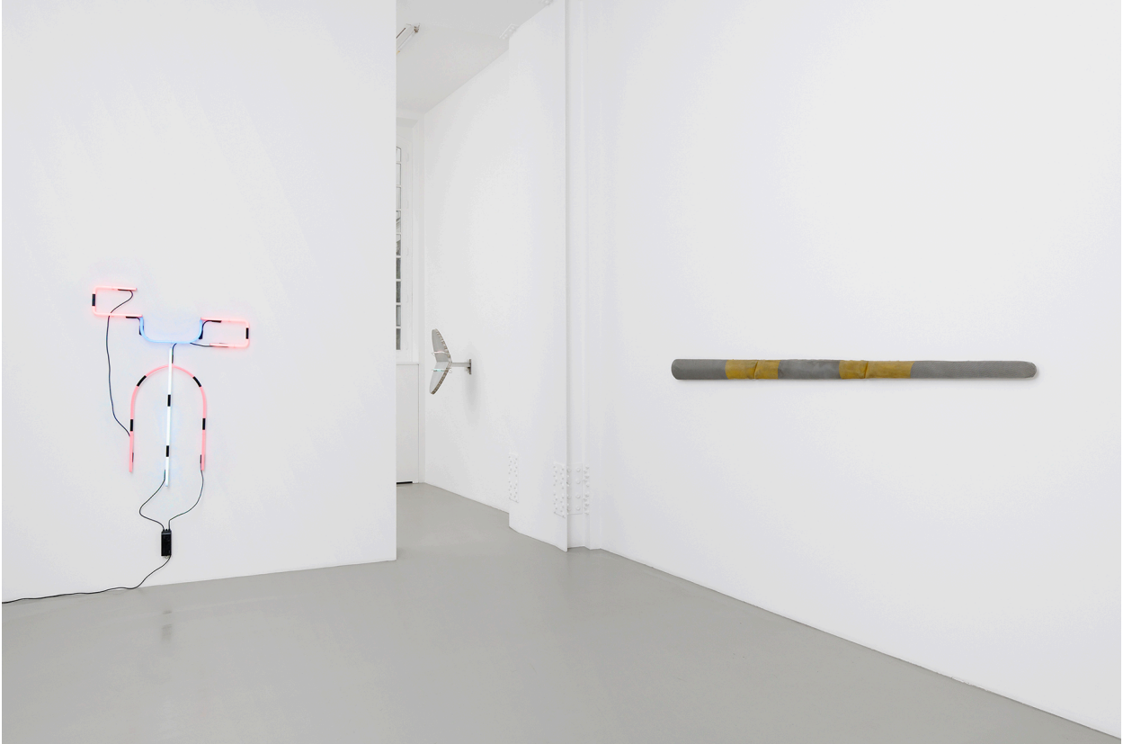
Vue de l'exposition, Files, Shields and Neons , Galerie Mitterrand, Paris, 2020 / Exhibition view, Files, Shields and Neons , Galerie Mitterrand, Paris, 2020.

79 RUE DU TEMPLE 75003 PARIS - T +33 1 43 26 12 05 F +33 1 46 33 44 83 INFO@GALERIEMITTERRAND.COM WWW.GALERIEMITTERRAND.COM