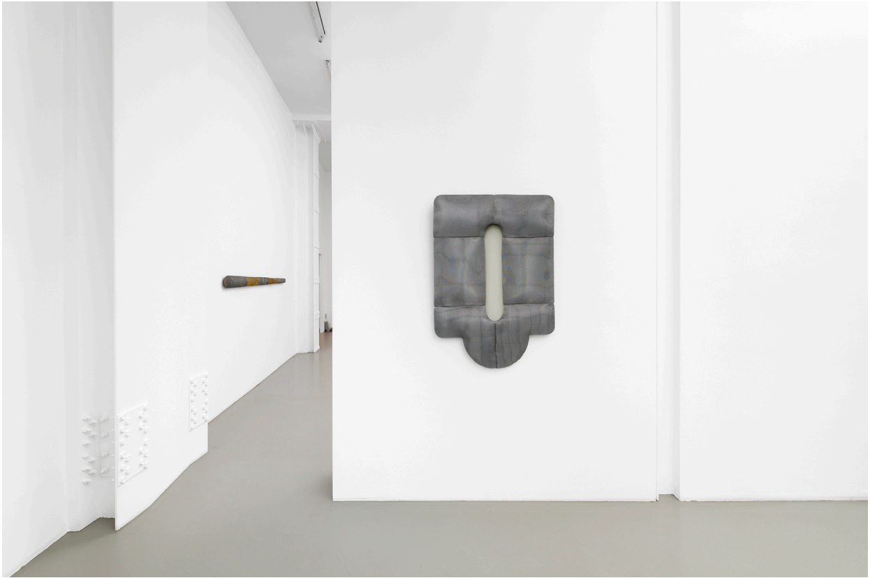
Vue de l'exposition, Files, Shields and Neons , Galerie Mitterrand, Paris, 2020 / Exhibition view, Files, Shields and Neons , Galerie Mitterrand, Paris, 2020.

79 RUE DU TEMPLE 75003 PARIS - T +33 1 43 26 12 05 F +33 1 46 33 44 83 INFO@GALERIEMITTERRAND.COM WWW.GALERIEMITTERRAND.COM