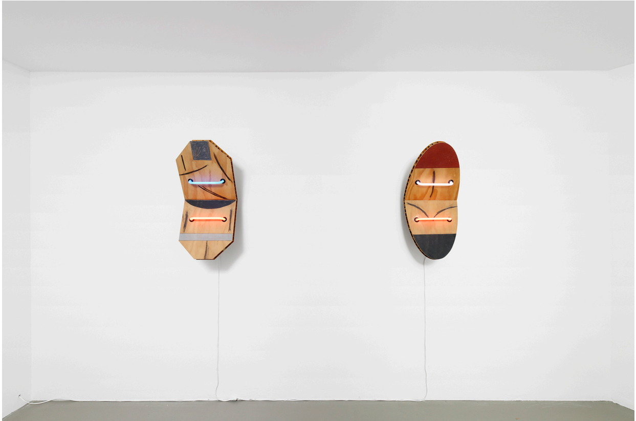
Vue de l'exposition, Files, Shields and Neons , Galerie Mitterrand, Paris, 2020 / Exhibition view, Files, Shields and Neons , Galerie Mitterrand, Paris, 2020.

79 RUE DU TEMPLE 75003 PARIS - T +33 1 43 26 12 05 F +33 1 46 33 44 83 INFO@GALERIEMITTERRAND.COM WWW.GALERIEMITTERRAND.COM