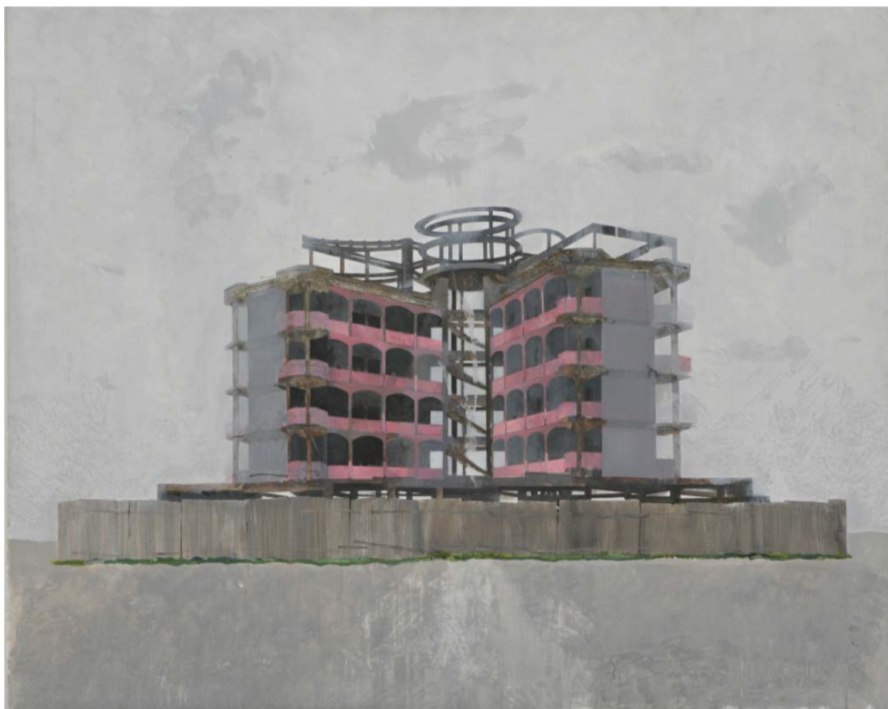
Edi Hila « House n.3 », 2000

Vernissage le 15 janvier de 18h00 à 21h00