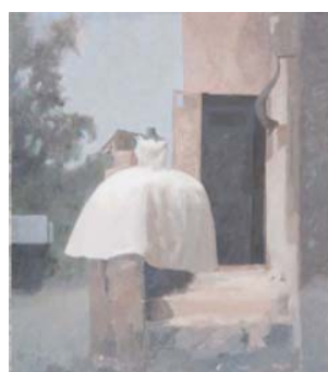
DANS LA RUE - LA ROBE DE MARIEE, 2007 Acrylique sur toile 91,5 x 103,5 cm