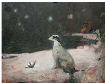
CHIEN DE FAÏENCE, 2008 Huile sur toile 147,5 x 118 cm