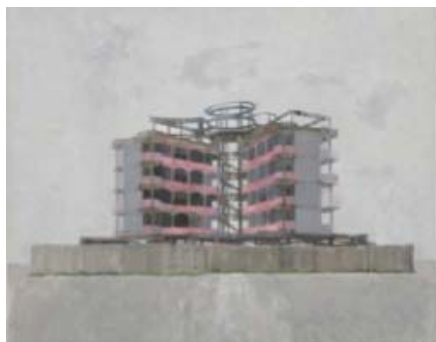
MAISON 3, 2000 Acrylique sur toile 130 x 136 cm