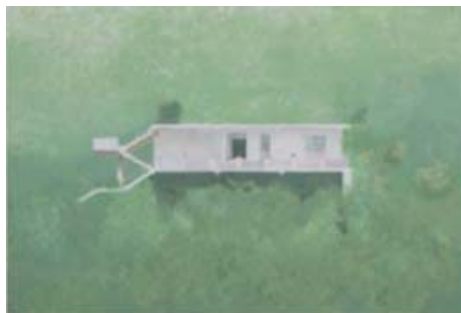
LA MAISON SUR FOND VERT N°1, 2006 Acrylique sur toile 91 x 135 cm