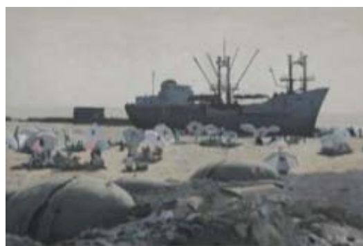
BANLIEUE - EN PLEIN SOLEIL, 2005 Acrylique sur toile 90 x 135 cm