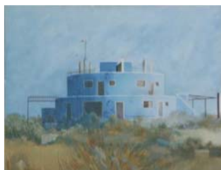
MAISON BLEUE, 2000 Acrylique sur toile 112 x 145 cm