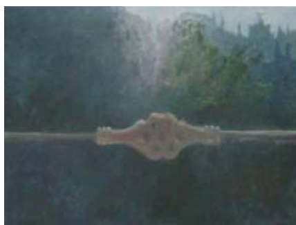
DEPUIS LA FENÊTRE, 2007 Acrylique sur toile 54 x 72,5 cm