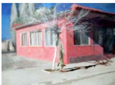
BANLIEUE - LA MAISON ROUGE, 2008 Acrylique sur toile 84 x 114 cm