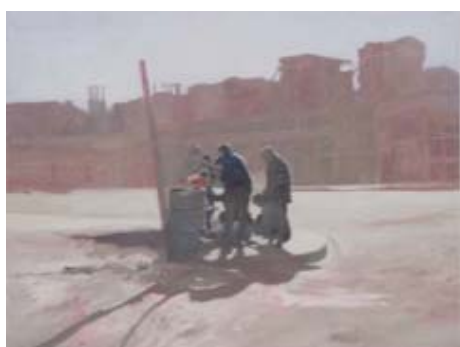
BANLIEUE - SCENE DE QUARTIER, 2005 Huile sur toile 110 x 130 cm